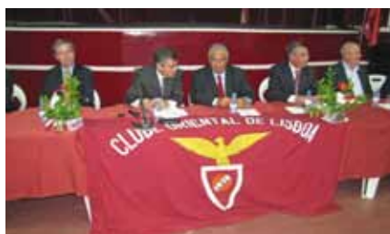
Sessão Solene do Oriental Homenagem a sócios