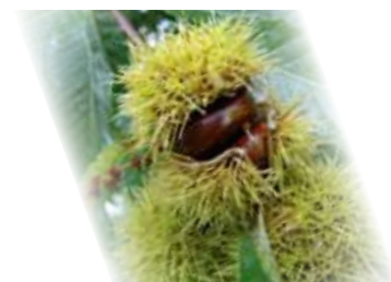
Magustos de S. Martinho animaram a Freguesia